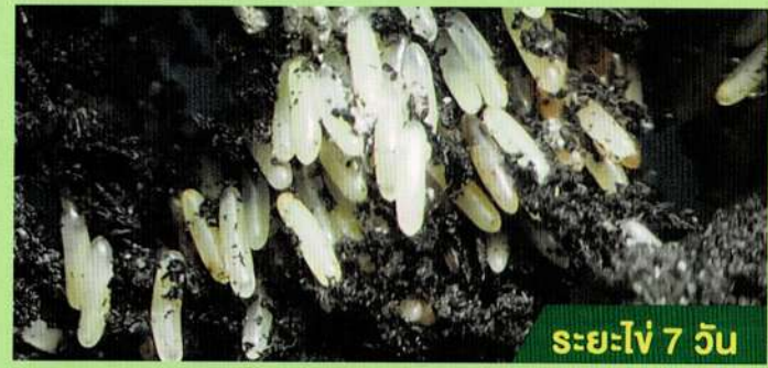
ระยะไข่ 7 วัน

ระยะไข่ ไข่จิ้งหรีดจะมีสีเหลือง ลักษณะยาวเรียวยาวคล้ายเมล็ดข้าวสาร ยาวประมาณ 1.5 มิลลิเมตร เพศเมียหนึ่งตัวสามารถวางไข่ได้ประมาณ 800-1,200 ฟองต่อครั้งหรือต่อรุ่น และวางไข่ได้ประมาณ 4 รุ่น