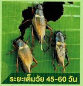
ระยะเต็มวัย 45-60 วัน

ระยะเต็มวัย สามารถแยกเพศได้ชัดเจน เพศผู้มีปีกคู่หน้ายื่น โดยใช้ปีกคู่หน้าสีให้เกิดเสียง เพศเมียมีอวัยวะวางไข่ คล้ายเข็มนูนจากส่วนท้อง จิ้งหรีดตัวเต็มวัยมีอายุเฉลี่ยประมาณ 45-60 วัน