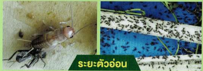
ระยะตัวอ่อน

ระยะไข่ ไข่จิ้งหรีดจะมีสีเหลือง ลักษณะยาวเรียวยาวคล้ายเมล็ดข้าวสาร ยาวประมาณ 1.5 มิลลิเมตร เพศเมียหนึ่งตัวสามารถวางไข่ได้ประมาณ 800-1,200 ฟองต่อครั้งหรือต่อรุ่น และวางไข่ได้ประมาณ 4 รุ่น